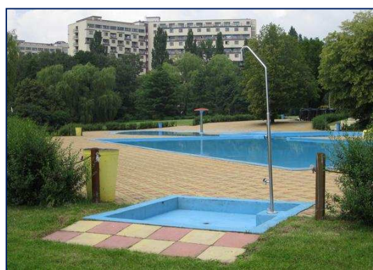
Areál letního koupaliště